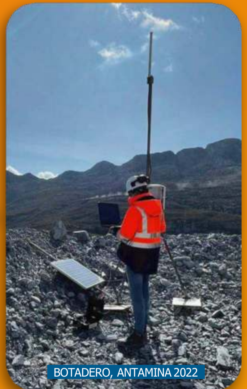
BOTADERO, ANTAMINA 2022